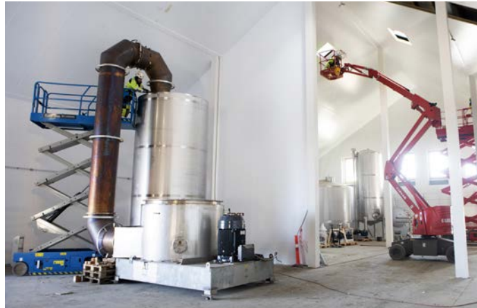
End del af det kommende tørreanlæg til proteinproduktet