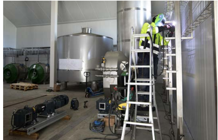
Konstruktion af kabelbærere til de kraftfulde elmotorer, der skal levere energi til produktionen