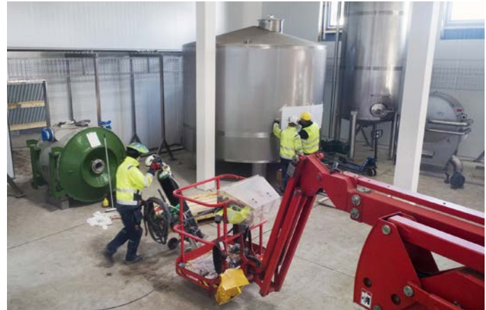
Tankanlæg mm. til vådprocessen. Væsken fra græsset opvarmes, hvorved proteinet i væsken fældes