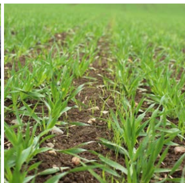
Udlægsmarken med hundegræs ser ud til at lykkes endnu en gang – selv om det er udlagt på traditionel vis