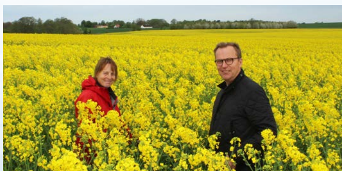
Veletableret vinterrapsmark med sorten Hitaly, der lover godt