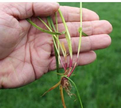
To knæ synlige på rajgræssets stængel – det er tid til vækstregulering