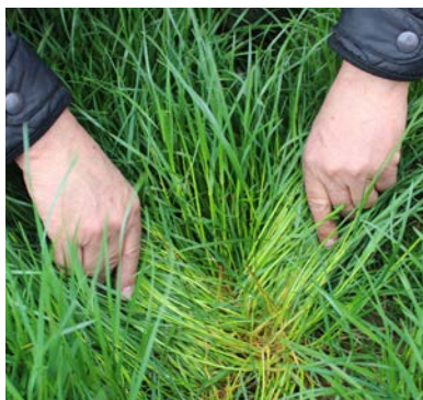
Rajgræsplanterne har dannet en masse frøbærende stængler og marken har et højt udbyttepotentiale