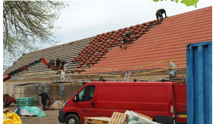
Håndværkere er i gang ude og inde på Algstrup Gods, hvor en aflængerne er under genopbygning efter en brand

De tilhørende svinestalde på Smakkerup Gods er udlejet til en svineproducent.