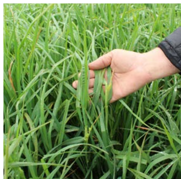
I hundegræs Amba har forårsfrosten bidt i de tidligste frøskud – men skaden er minimal